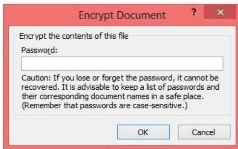
Gambar 4.1 Encrypt Document