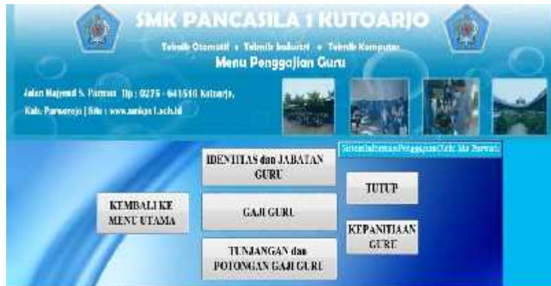
Gambar 3.2 Tampilan menu penggajian guru

Menu guru berisi komponen yang ada dalam penggajian meliputi submenu identitas, jabatan, gaji, tunjangan, potongan gaji guru. Menu guru juga berisi tombol kembali ke menu utama dan tutup tampil