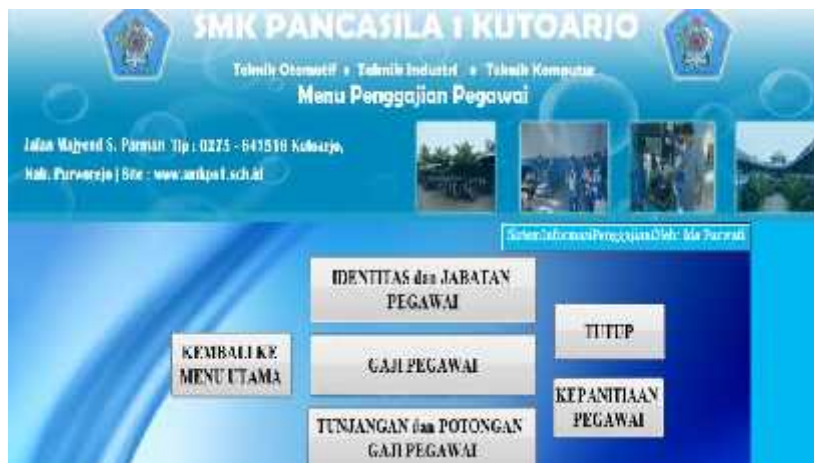
Gambar 3. 3 Tampilan menu penggajian pegawai

Menu pegawai berisi komponen yang ada dalam penggajian meliputi submenu identitas, jabatan, gaji, tunjangan, potongan gaji pegawai. Menu pegawai juga berisi tombol kembali ke menu utama dan tutup tampilan