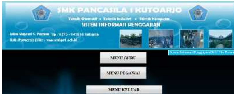
Gambar 3.1 Tampilan menu utama

Menu utama merupakan menu tampil yang setelah password diisi. Menu utama berisi menu guru, menu pegawai, dan menu keluar